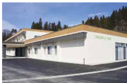
地域密着型特別養護老人ホーム 袖崎