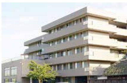
介護老人保健施設 庭の里