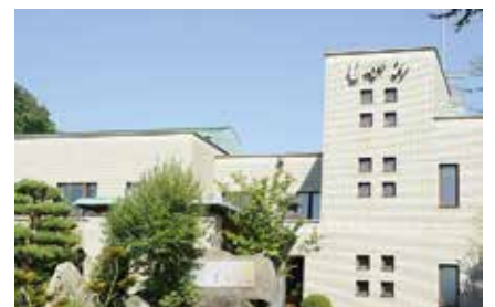
健康福祉プラザ もがみ